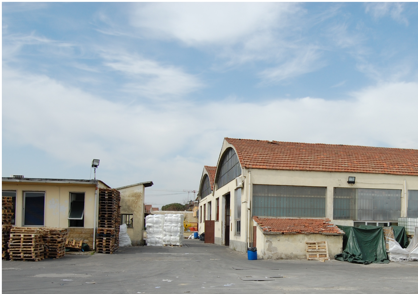
FOTO 1 - Il piazzale della fabbrica