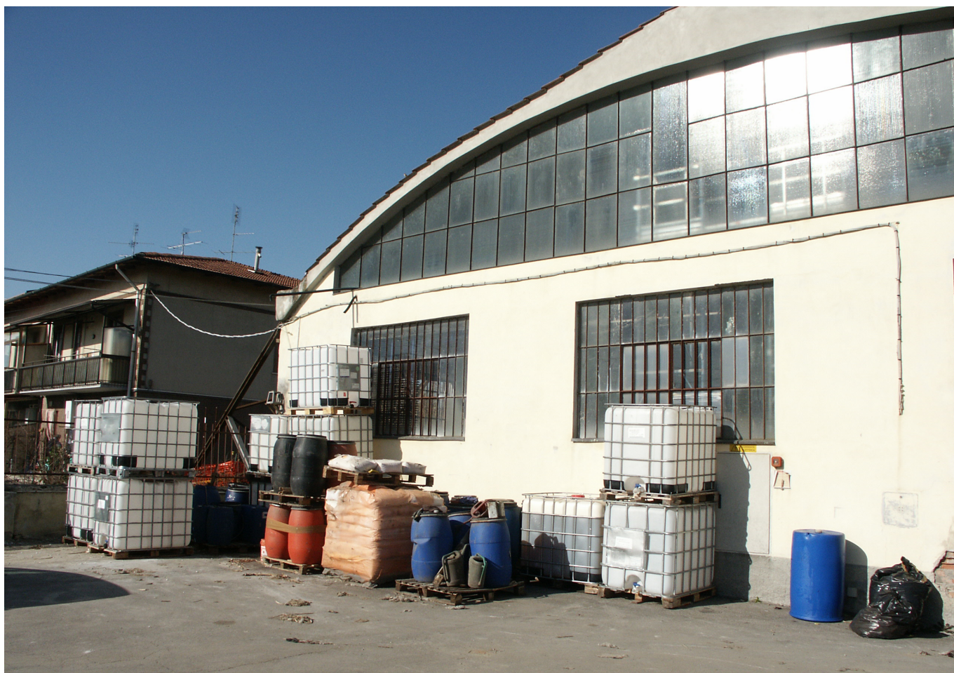
FOTO 4 - Il fronte principale dell'edificio