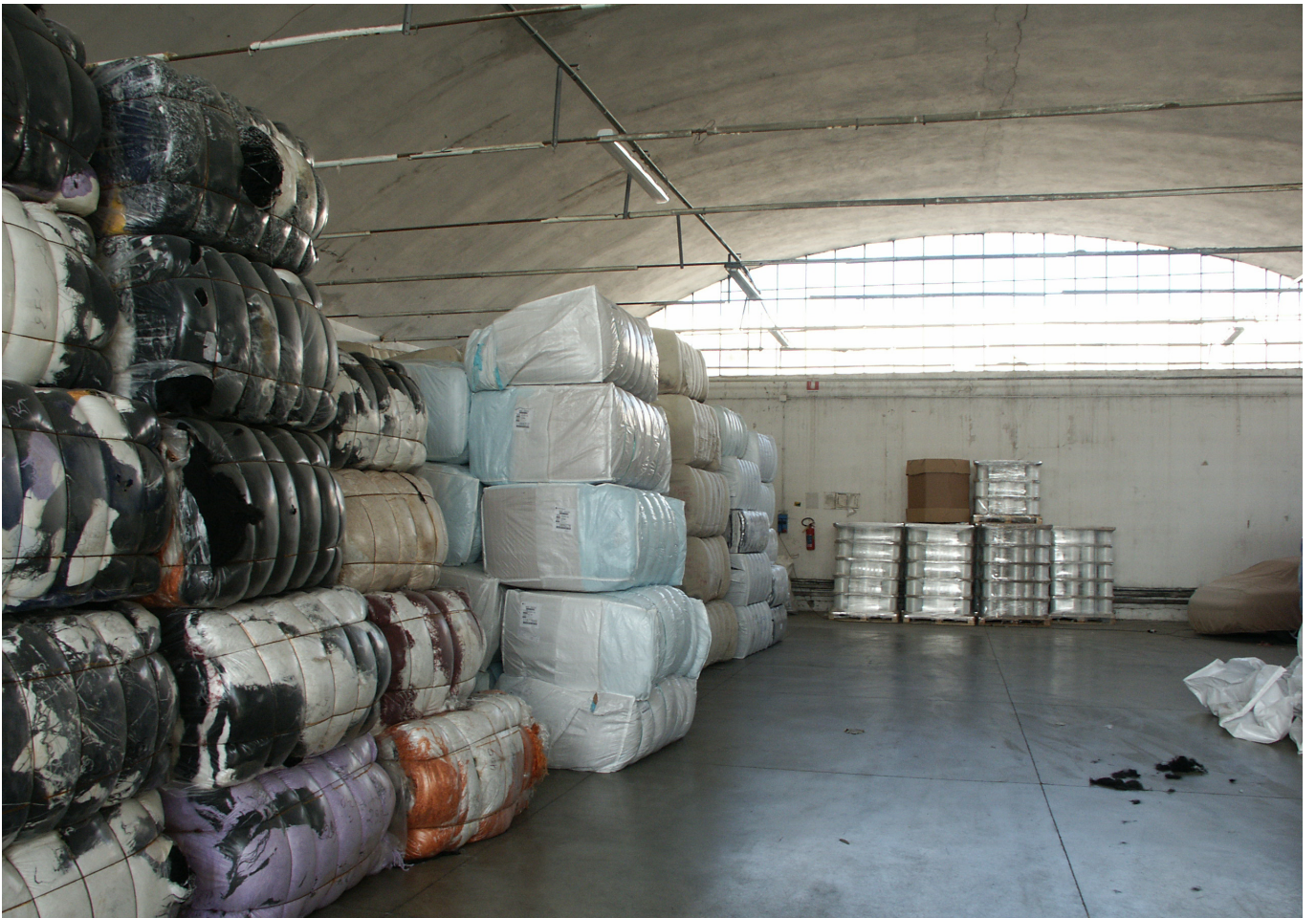
FOTO 9 - Vista interna dell'edificio