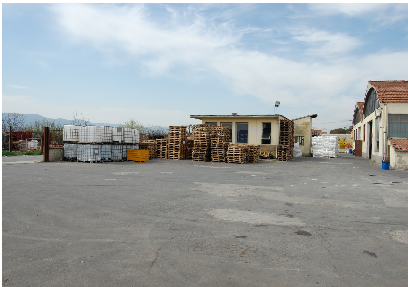
FOTO 2 - Il piazzale della fabbrica