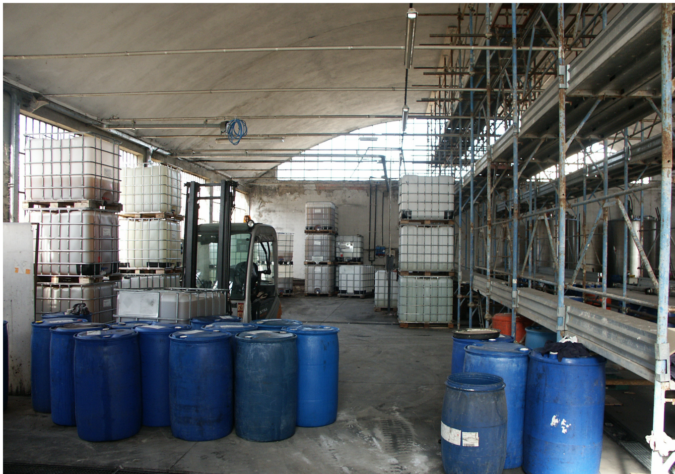
FOTO 7 - Vista interna dell'edificio