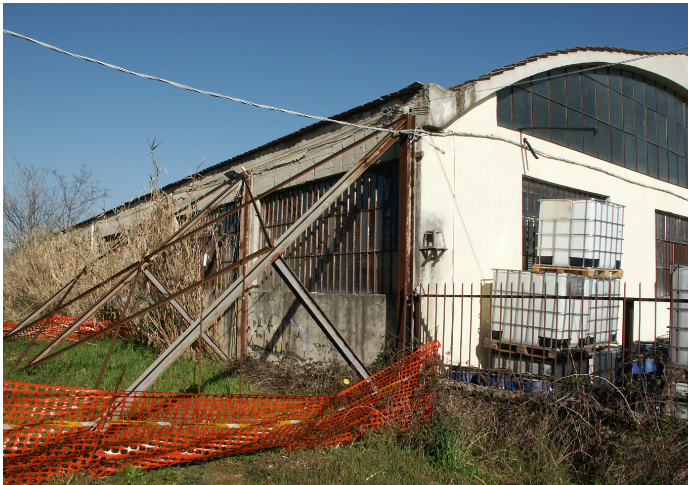
FOTO 5 - Vista verso est dell'edificio