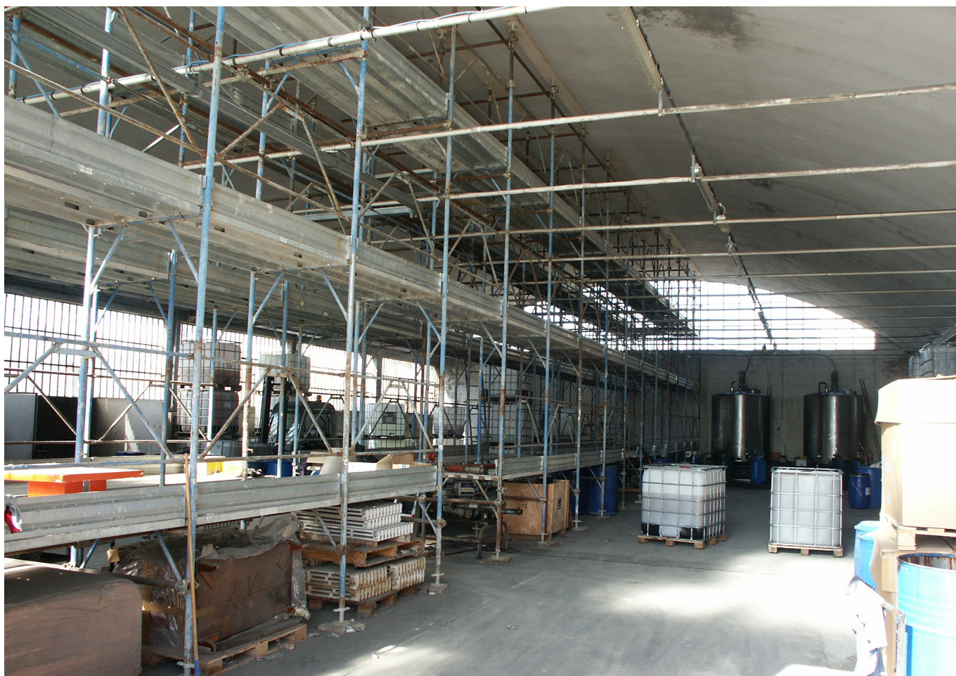
FOTO 8 - Vista interna dell'edificio