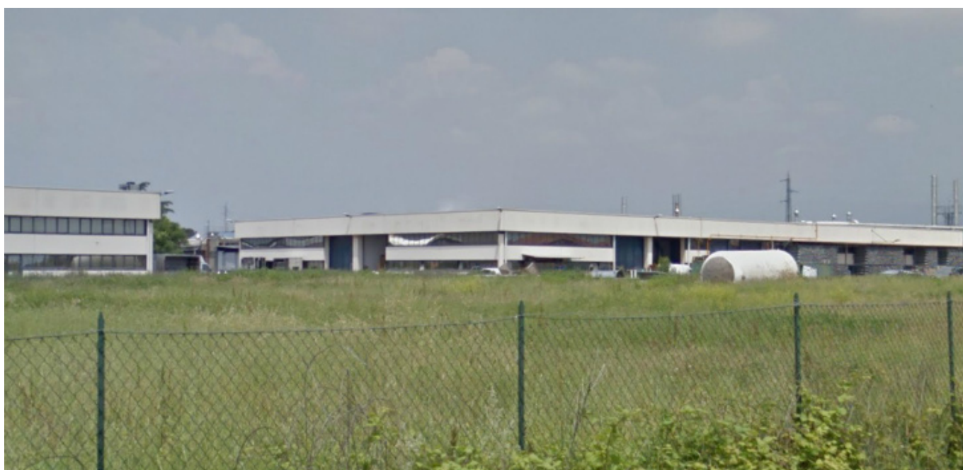
FOTO 11 -12 - 13 - Vista della INTECH, sulla sinistra, e dell'adiacente complesso NARDI FILATI