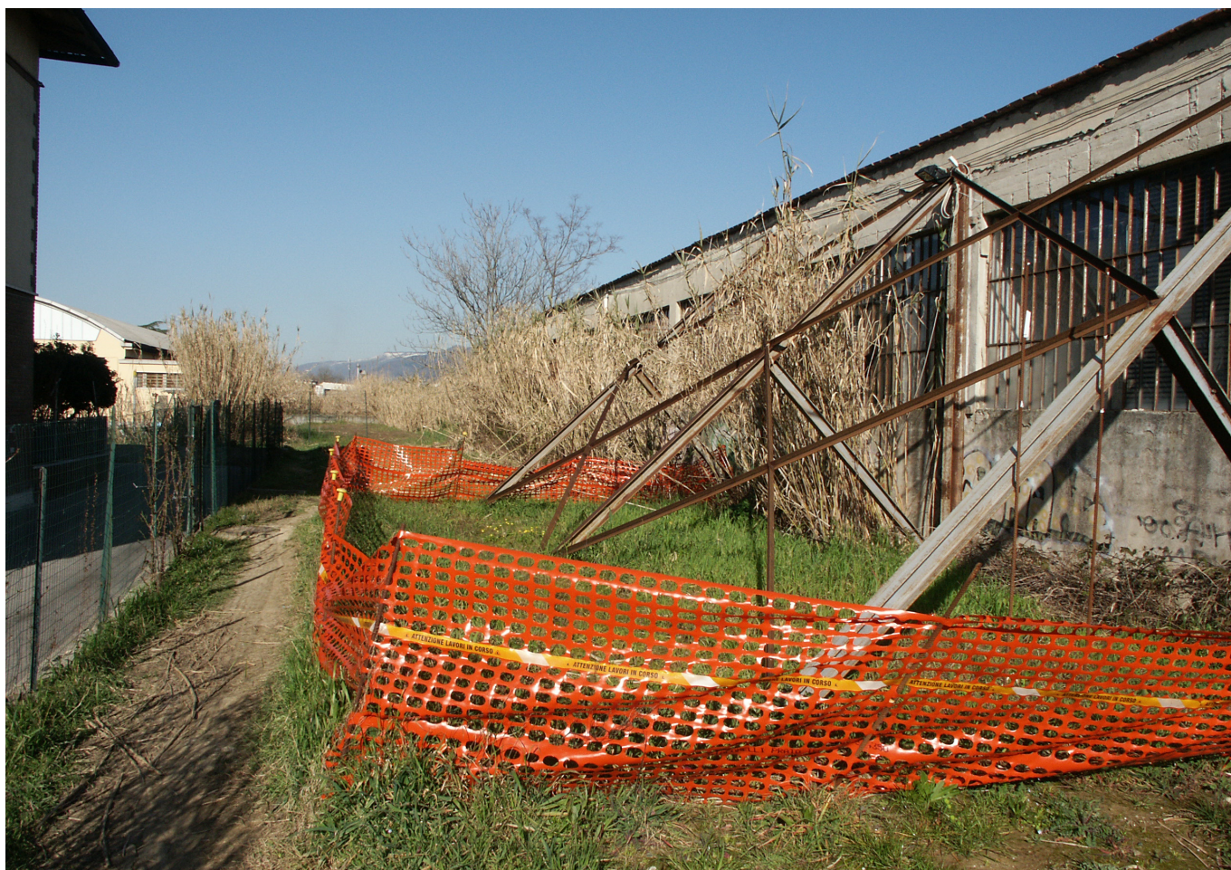
FOTO 6 - Vista dell'edificio e del tratto intubato della gora del Palasaccio