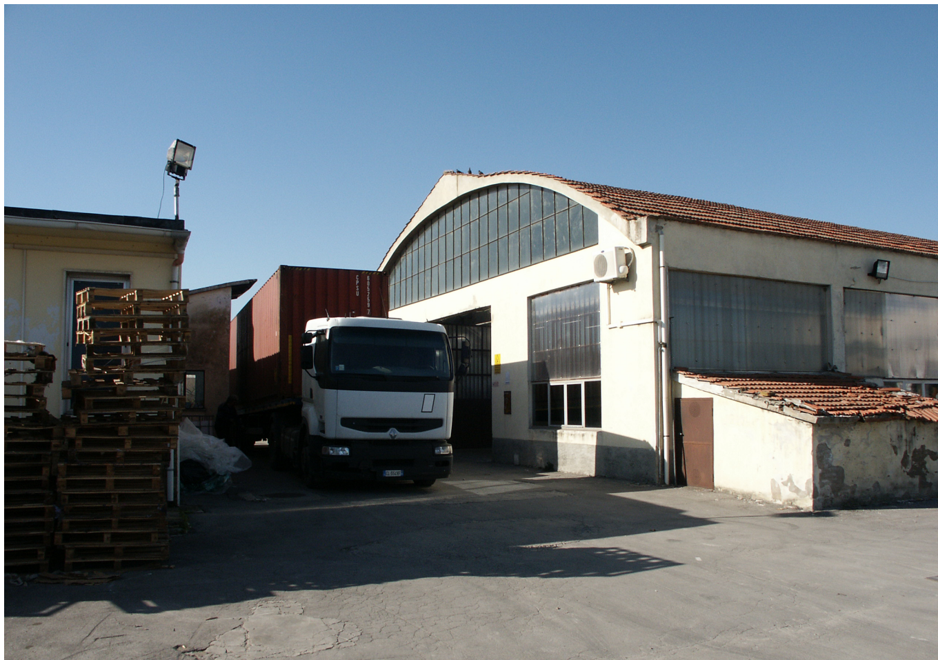
FOTO 3 - Il piazzale della fabbrica