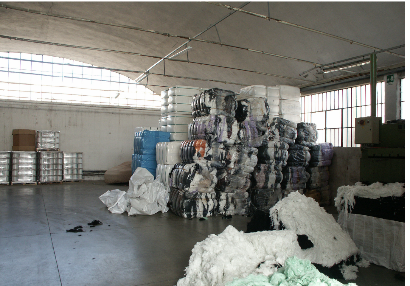
FOTO 10 - Vista interna dell'edificio