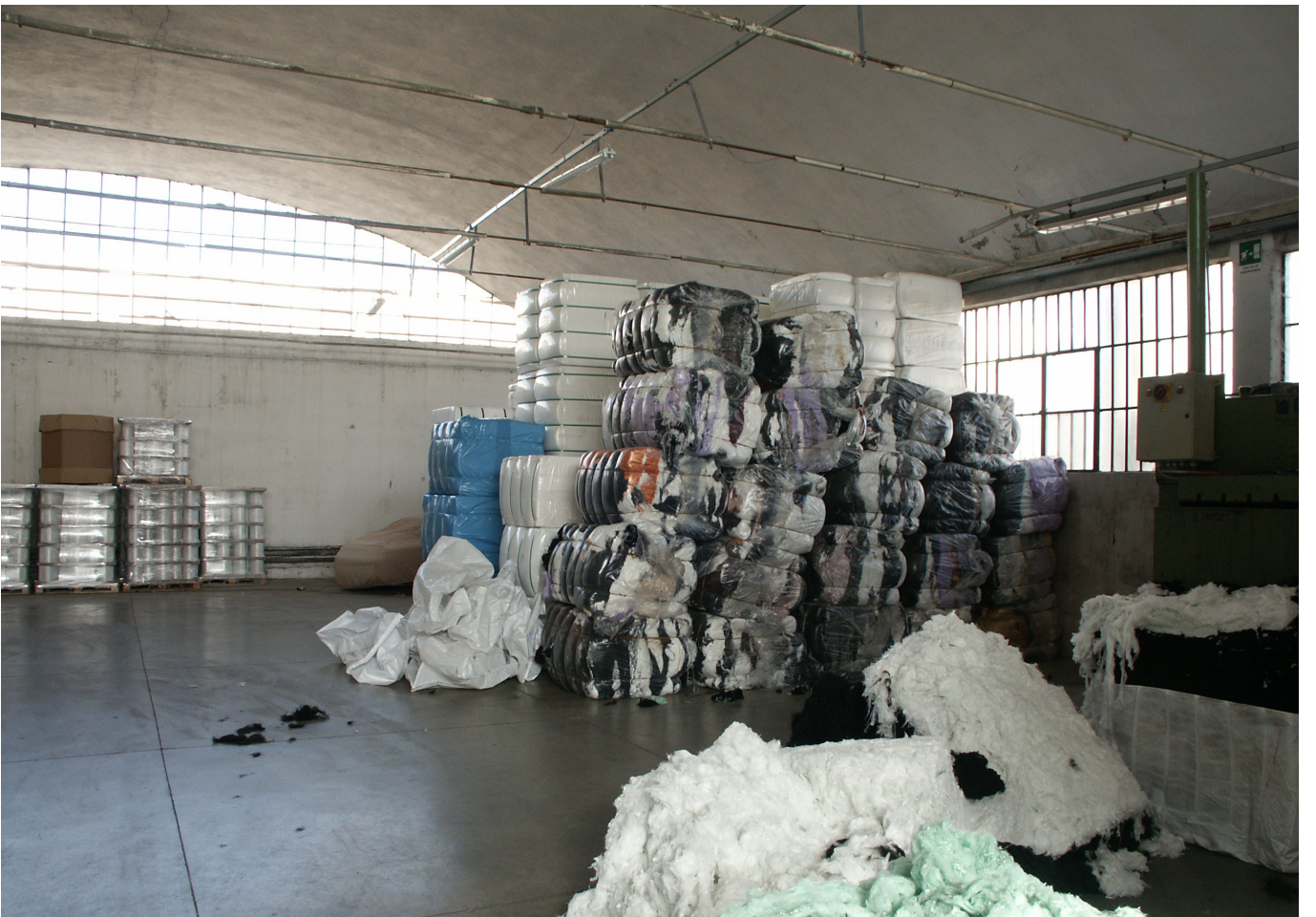
FOTO 10 - Vista interna dell'edificio