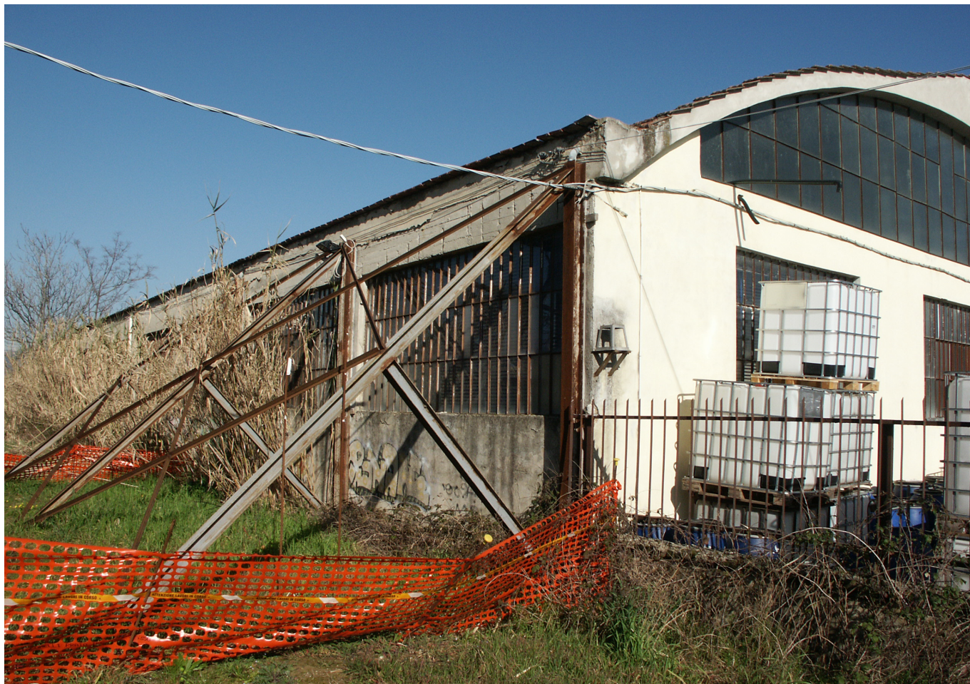
FOTO 5 - Vista verso est dell'edificio