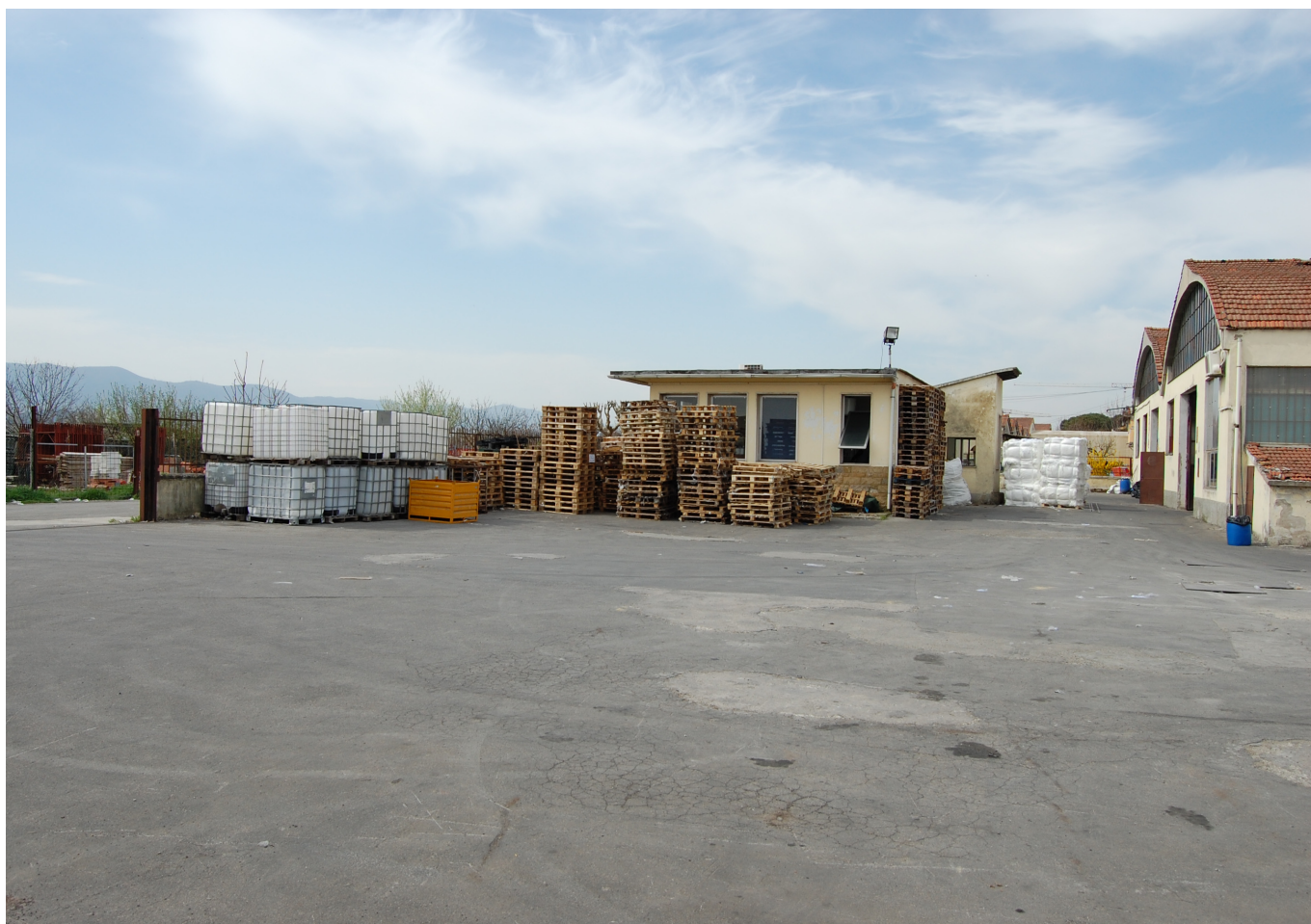
FOTO 2 - Il piazzale della fabbrica