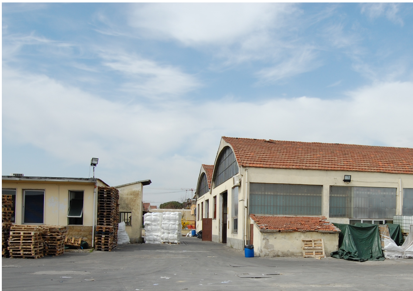
FOTO 1 - Il piazzale della fabbrica