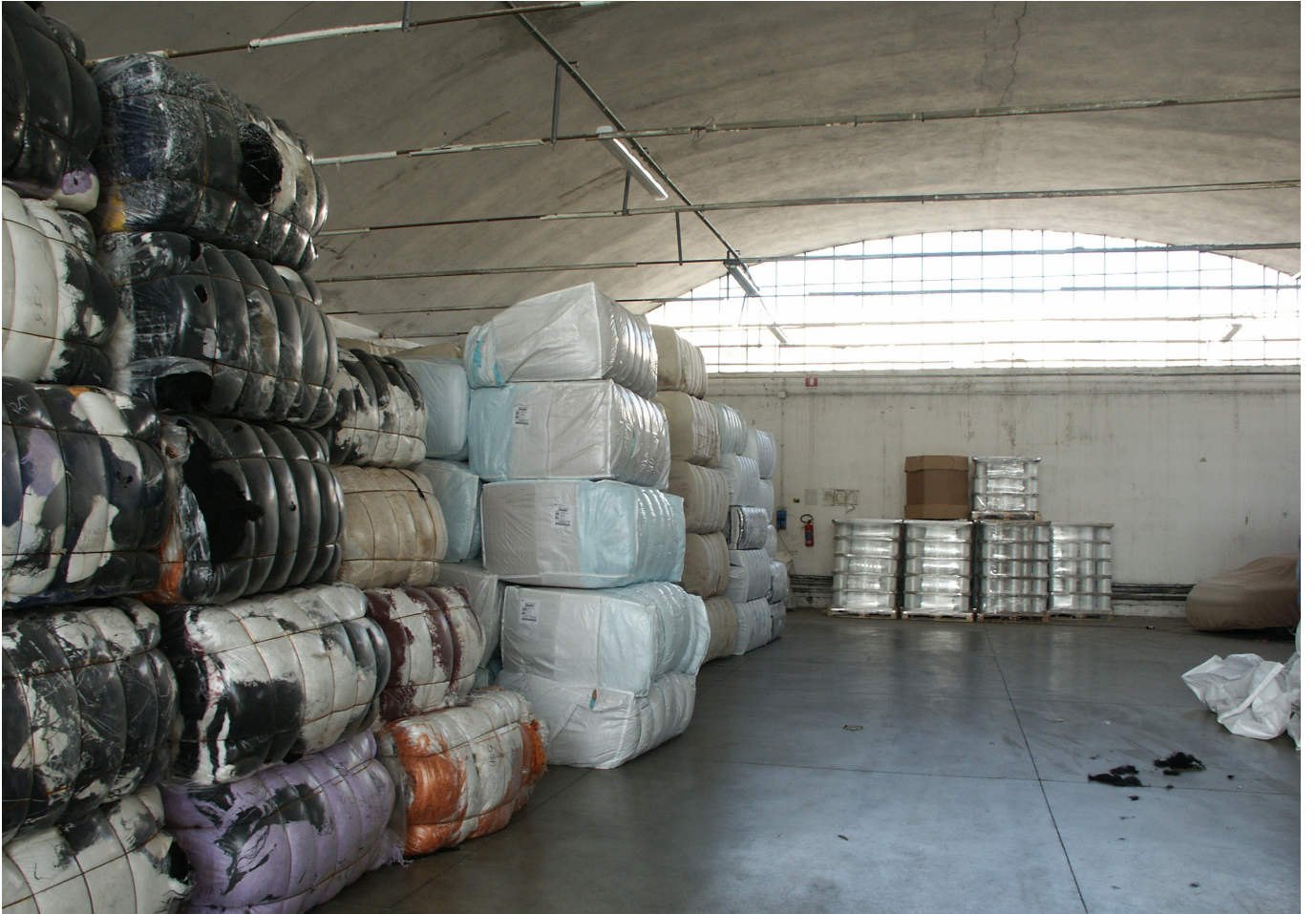
FOTO 9 - Vista interna dell'edificio