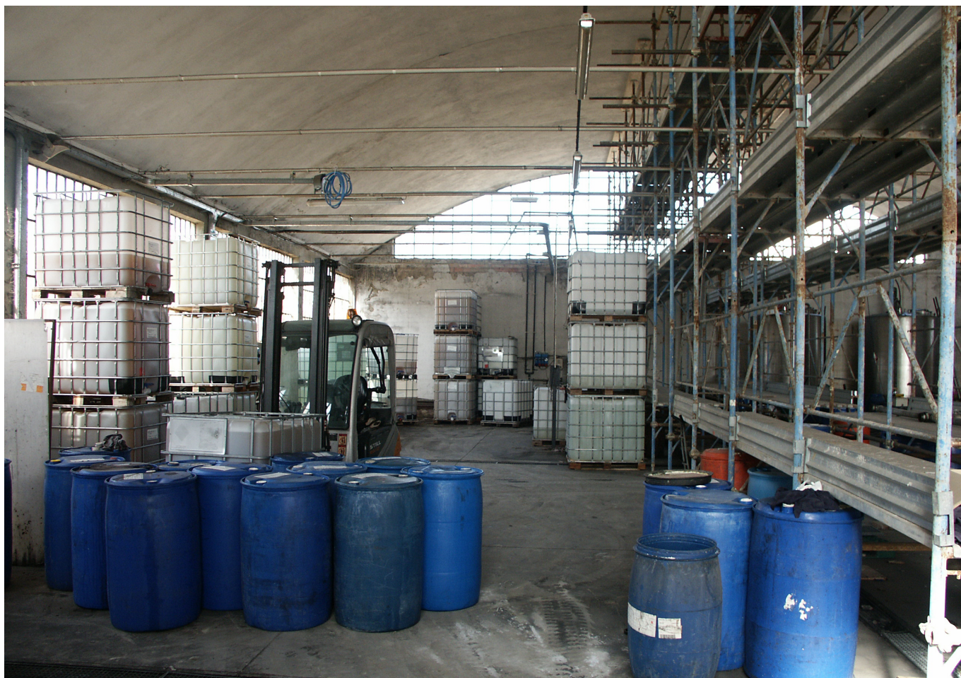
FOTO 7 - Vista interna dell'edificio