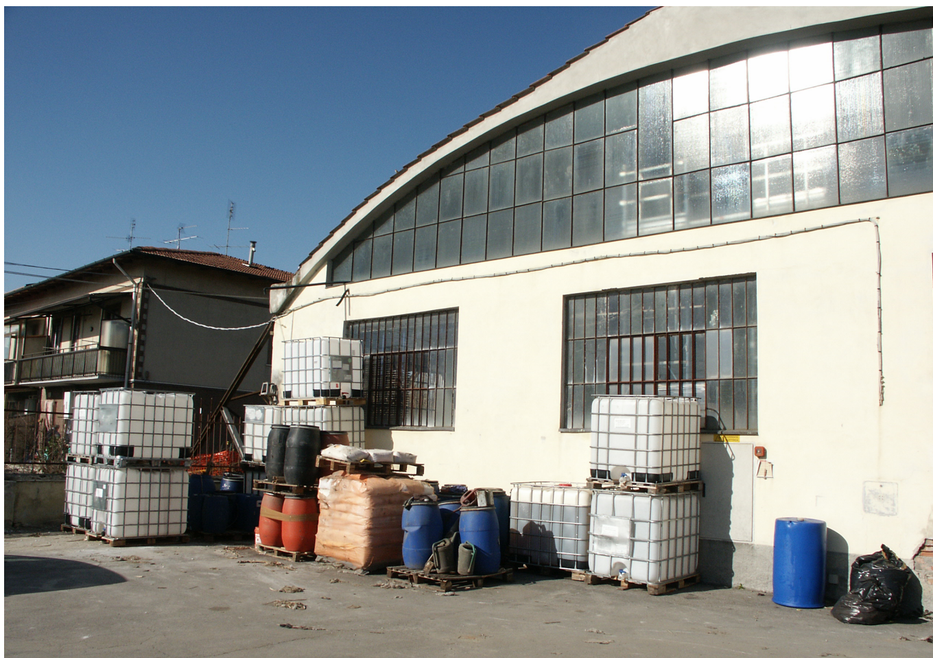
FOTO 4 - Il fronte principale dell'edificio