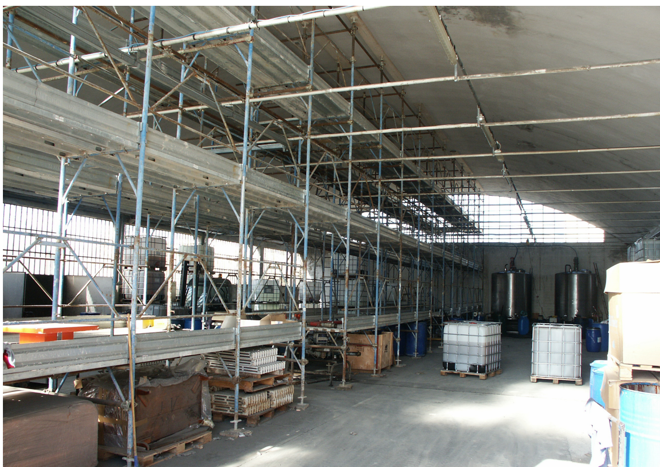
FOTO 8 - Vista interna dell'edificio