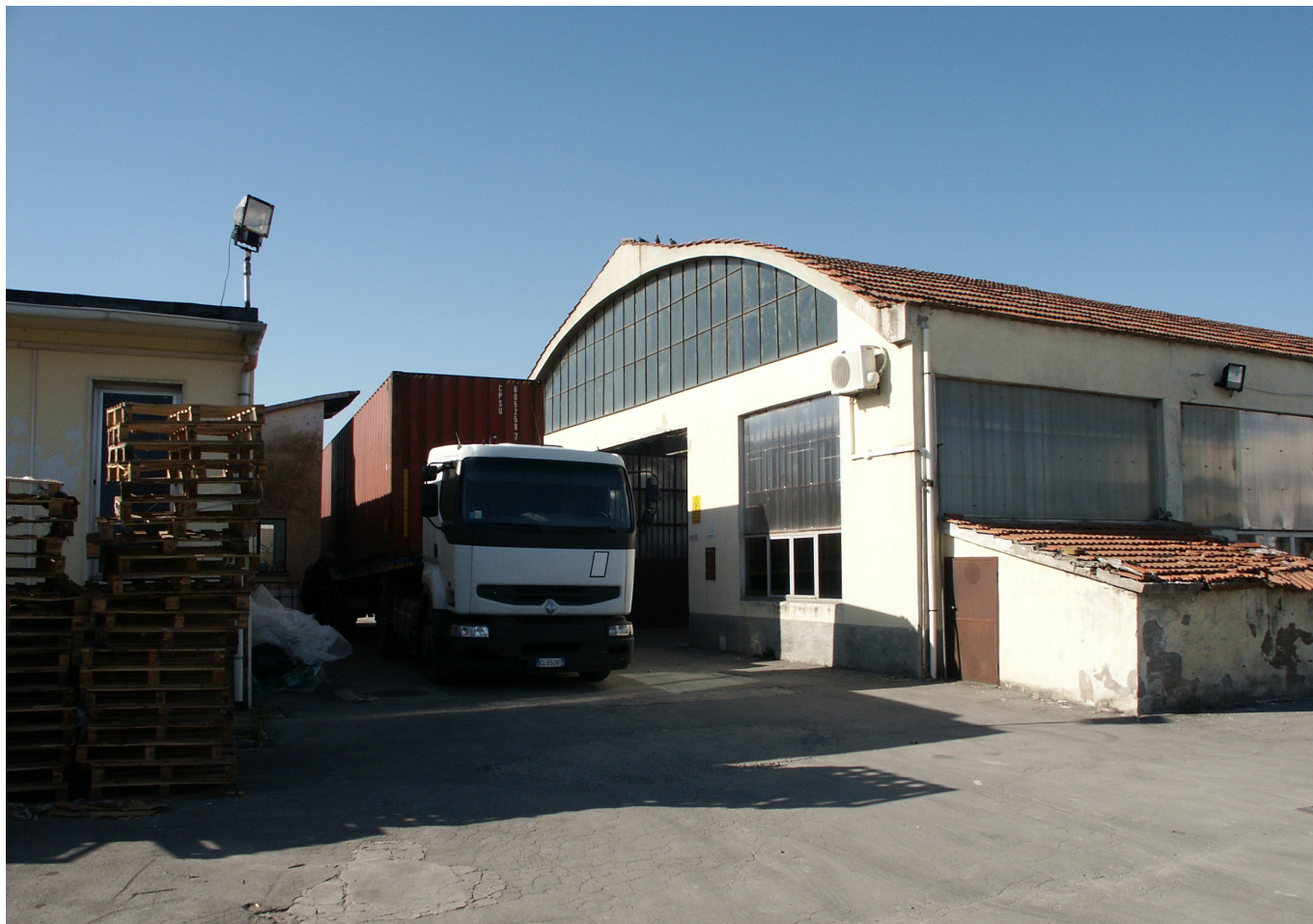
FOTO 3 - Il piazzale della fabbrica