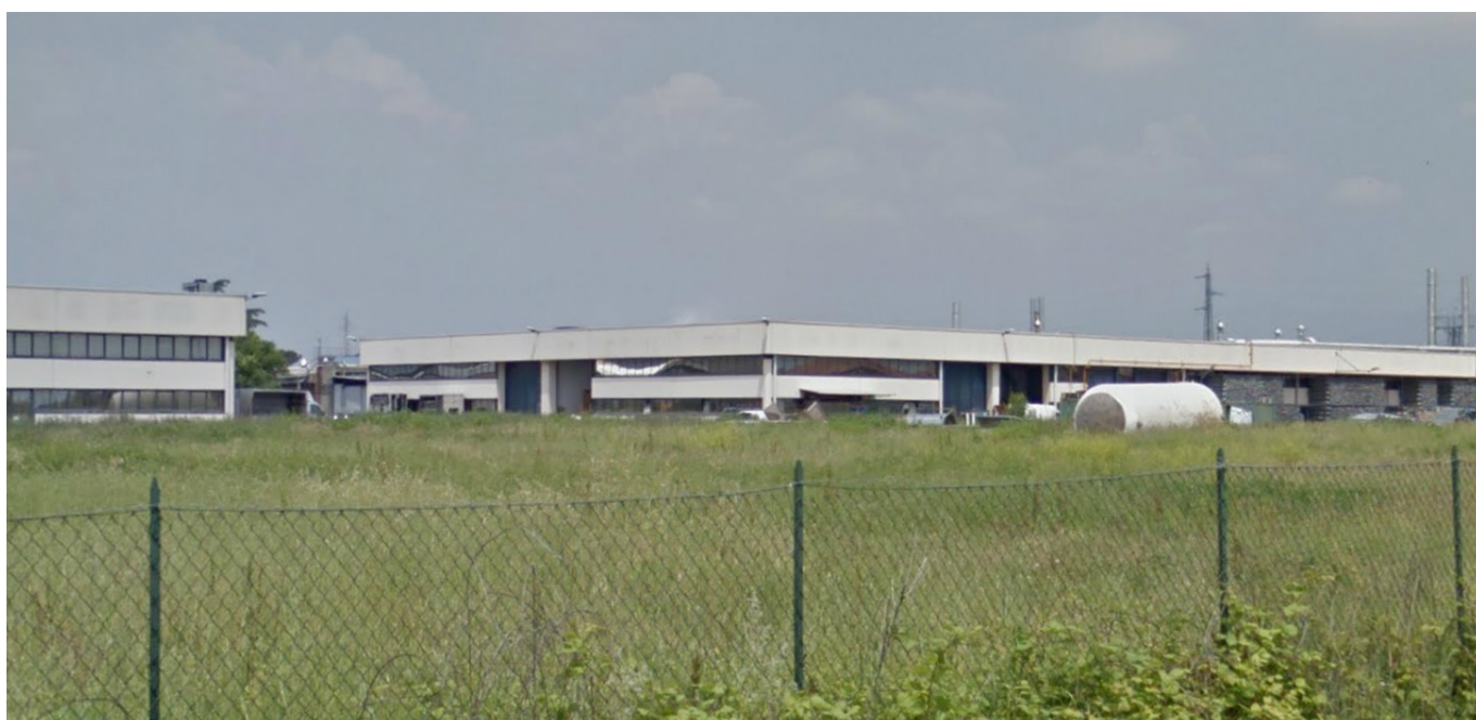
FOTO 11 -12 - 13 - Vista della INTECH, sulla sinistra, e dell'adiacente complesso NARDI FILATI